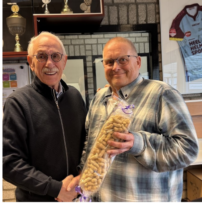
Een zak vol noten.