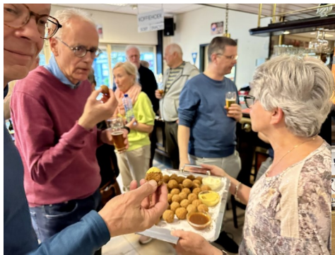
Deze bittere ballen liet men zich smaken en waren goed te verteren, met 'n likje mosterd.