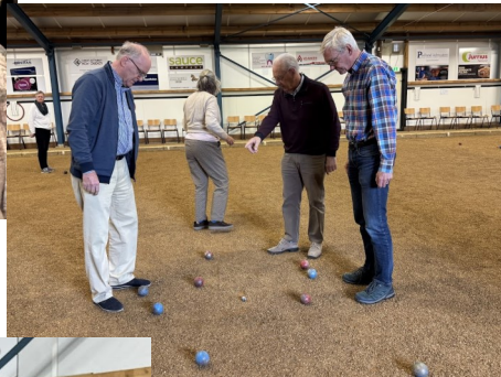
Littie of Littie nie? Meten is weten.