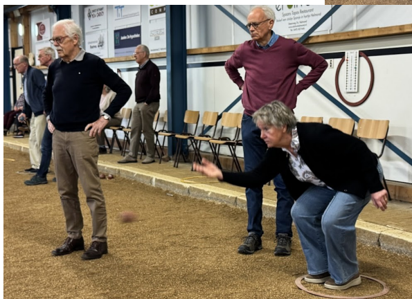
Uiterste concentra- tie, vanuit een juiste houding en positie zoals bij het zingen.