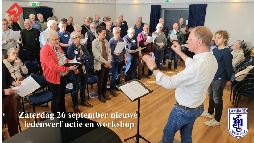
Zaterdag 26 september nieuwe ledenwerf actie en workshop