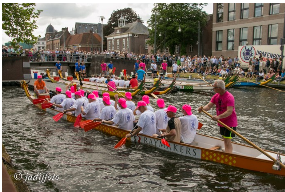
Roeien op het Kanaal door deelname van 19 enthousiaste koorleden aan het Drakenbootfestival tijdens de pinksterdagen. We gingen ze allemaal aanmoedigen.