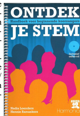
Cursusboek & oefen CD